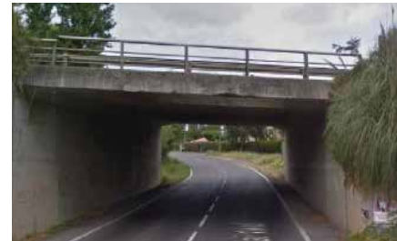
Pont de la route D 26 avant travaux.

Le pont de la route départementale 26 , situé sur la commune de Ondres, va être élargi de part et d'autre du pont existant.