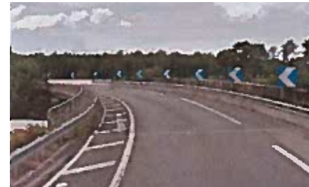
RD 824 avant travaux.

Le pont de la route départementale 824, situé sur la commune de Saint-Geours-de-Maremne, va être démoli puis reconstruit au même emplacement.