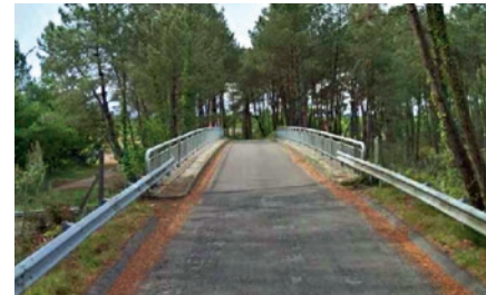
Route des Monts avant travaux.

Le pont de la route des Monts, situé sur la commune de Saint-Geours-de-Maremne, va être démoli puis reconstruit au même emplacement.