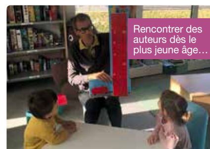
Rencontrer des auteurs dès le plus jeune âge...