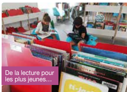
De la lecture pour les plus jeunes...