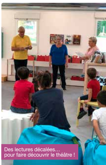
Des lectures décalées... pour faire découvrir le théâtre !