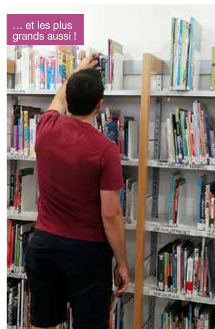
... et les plus grands aussi !