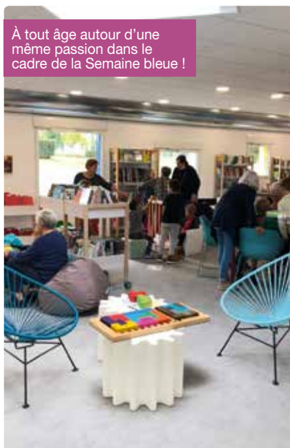
À tout âge autour d'une même passion dans le cadre de la Semaine bleue !