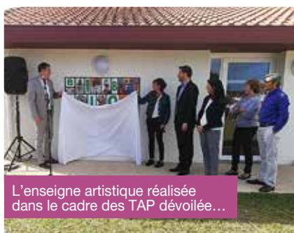
L'enseigne artistique réalisée dans le cadre des TAP dévoilée...

Retour en images sur certains temps forts de ce Mois de la découverte... Et si vous ne connaissez pas encore la ludo-bibliothèque, notez qu'elle se situe au 211 chemin de Tambourin, à côté de l'école maternelle. Horaires : Mardi de 10h à 12h30 et de 15h30 à 18h30. Mercredi de 10h à 18h30. Vendredi de 10h à 12h30 et de 15h30 à 18h30. Enfin, samedi de 10h à 12h30. ■