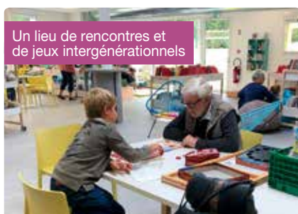
Un lieu de rencontres et de jeux intergénérationnels