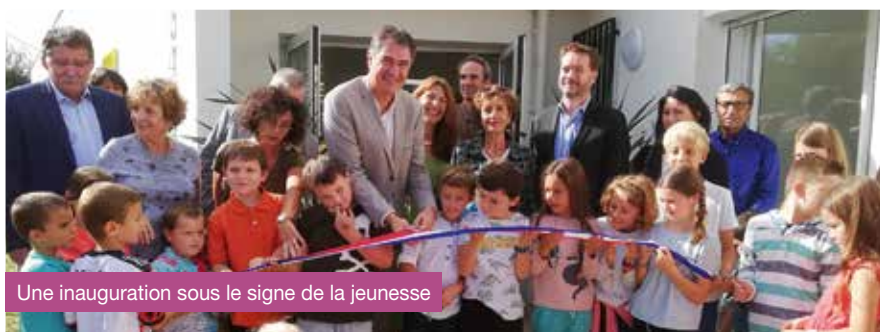
Une inauguration sous le signe de la jeunesse