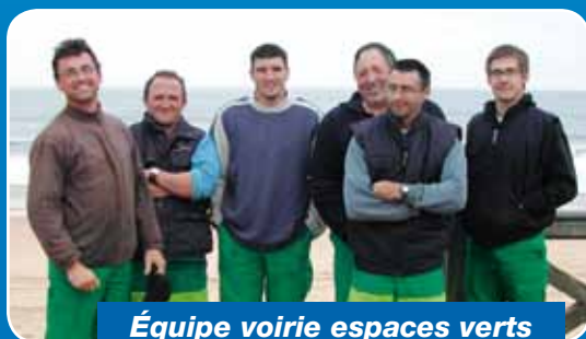
Équipe voirie espaces verts