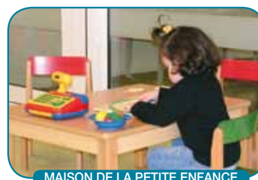
MAISON DE LA PETITE ENFANCE